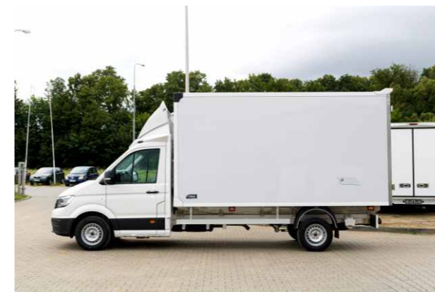
MAN TGE z zabudową izoterma firmy LAMAR.

Mimo wszystko w dobrze przemyślanej zabudowie o walorach użytkowych tego wariantu decyduje wyposażenie wnętrza. I tutaj nasz MAN TGE możemy doposażyć np. w boczne drzwi jednoskrzydłowe, windę kolumnową, czy ruchomą ścianę działową, choć i te przykłady nie zamykają pełnej palety rozwiązań.