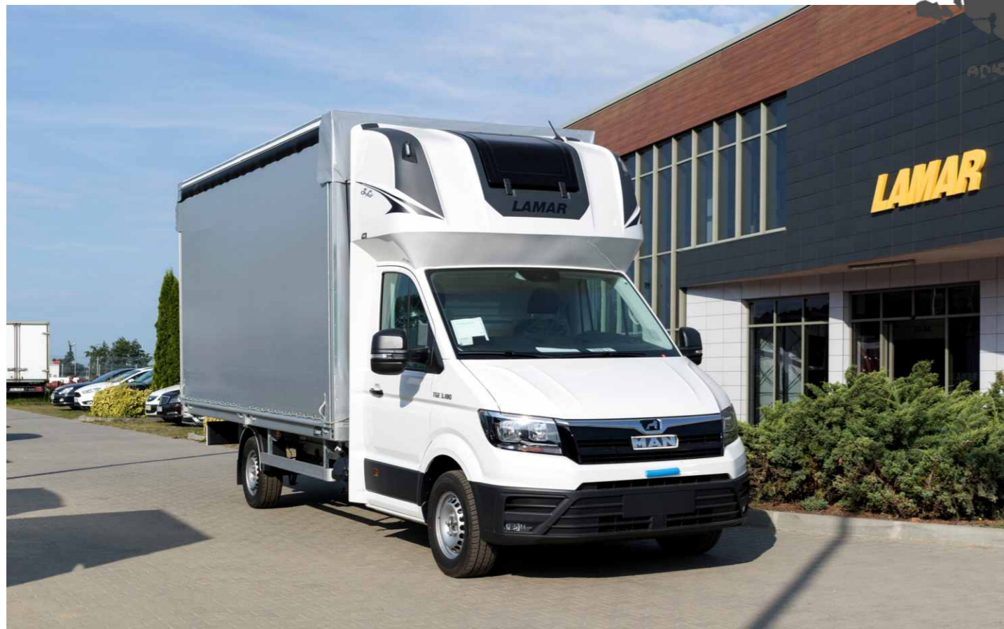
MAN TGE z zabudową skrzyniową. Burtofirana boczna 8-mio paletowa z kabiną sypialną SkyCab.

Wszechstronne zabudowy dla MAN-a TGE firmy Lamar