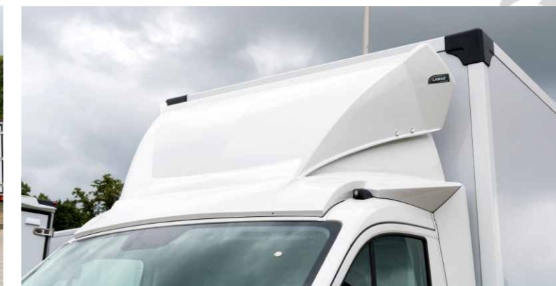
Spojler dachowy o regulowanym koncie nachylenia to element obowiązkowy przy każdej zabudowie przestrzennej.