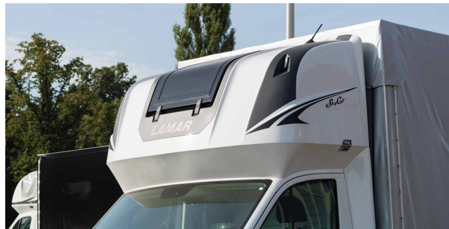
Wiodącej kabiny sypialnej firmy LAMAR SkyCab nie sposób nie zauważyć na drogach całej Europy.