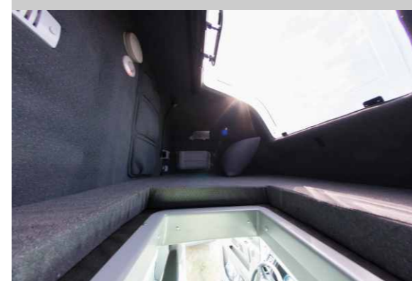
To jedyna kabina sypialna na polskim rynku posiadająca przednie okno czołowe. W środku jest jasno i przestronnie.