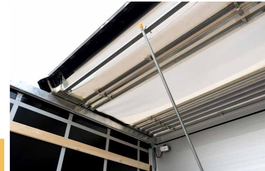
System dachu przesuwanego w zabudowie plandekowej ułatwia załadunek i rozładunek.

Pojazd użytkowy to dla wielu firm typowy „wół roboczy” – musi spełniać określone funkcje. Zabudowy twarde jakimi są nadwozia kontenerowe to modelowy produkt dedykowany firmom dystrybucyjnym, dostawcom, ale także przewoźcom