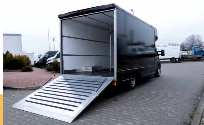
LAMBox transportowy z opuszczanym na silownikach trapem. Zabudowa może być także wyposażona w windę 750 kg.