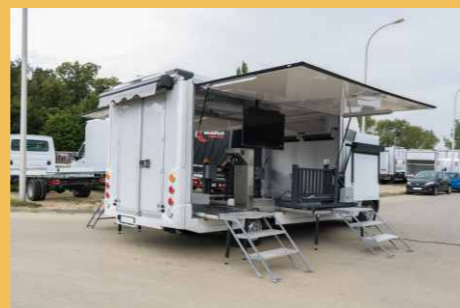
MAN TGE może przyjąć formę mobilnej ekspozycji bazującej na nadwoziu LAMBox