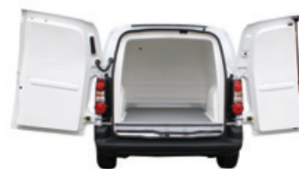
Wkłady izotermiczne do furgonów