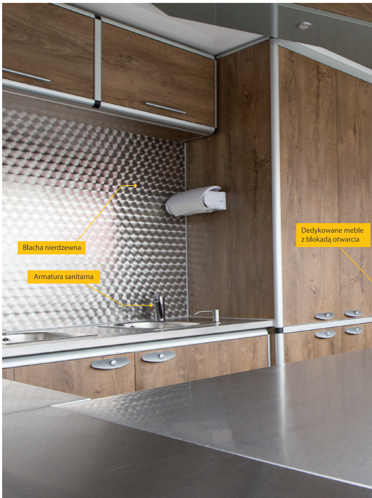
Przykładowe wyposażenie Food Trucka