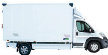
Chłodnie i izotermi